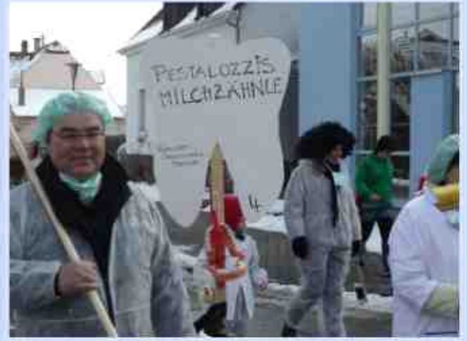
15.02.2010, Faschingsumzug Neuburgweier