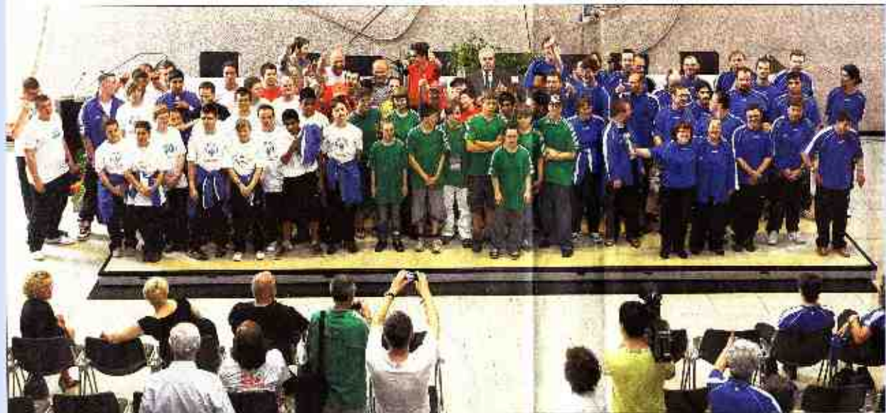
UNTERSCHEIDUNG IM HAUS: Du hast Ferlach verabschiedete gestern die Karlsruhe Teilnehmer der Special Olympics National Games in Bremen.