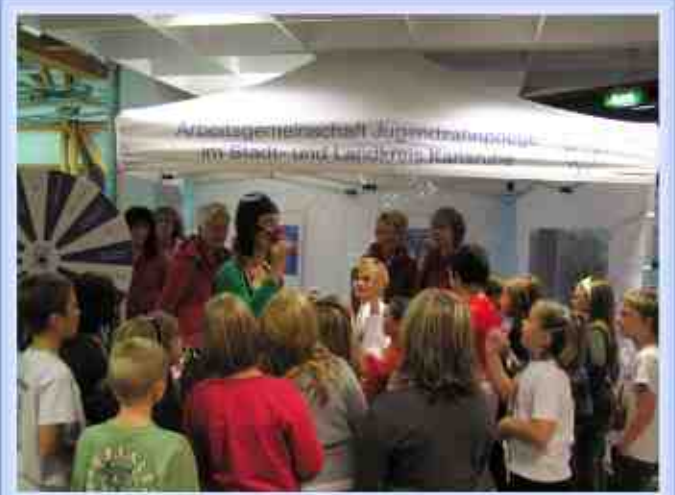
Besuch der Trainerin und einer Spielerin der A-Junorinnen des Deutschen Handball-Nationalteams