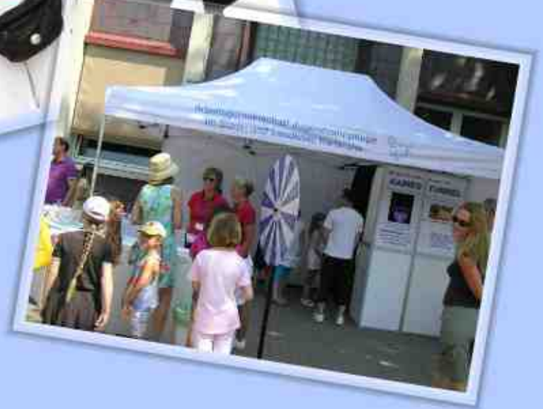
03.07.2010 Sommerfest Drais-Schule im Rahmen Stadtteilprojekt "Gesund aufwachsen in Mühlburg"